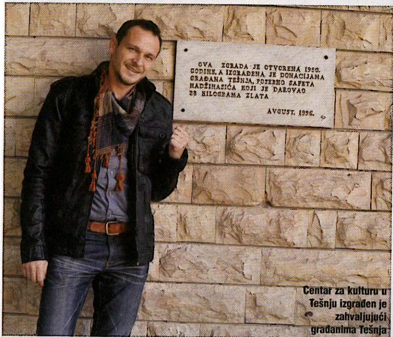
Centar za kulturu u Tešnju izgrađen je zahvaljujući građanima Tešnja