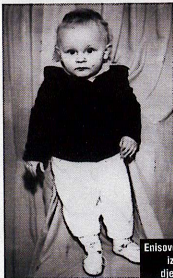
Enisove uspomene iz ranog djetinjstva

– Igra, konstantna igra, kao i većine djece koja su