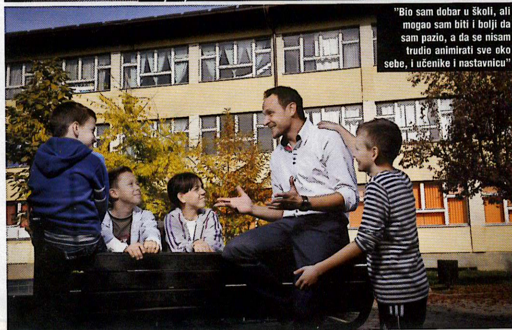
"Bio sam dobar u školi, ali mogao sam biti i bolji da sam pazio, a da se nisam trudio animirati sve oko sebe, i učenike i nastavnicu"