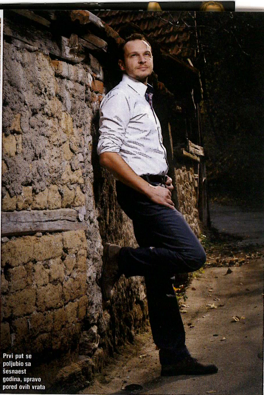
Prvi put se poljubio sa šesnaest godina, upravo pored ovih vrata