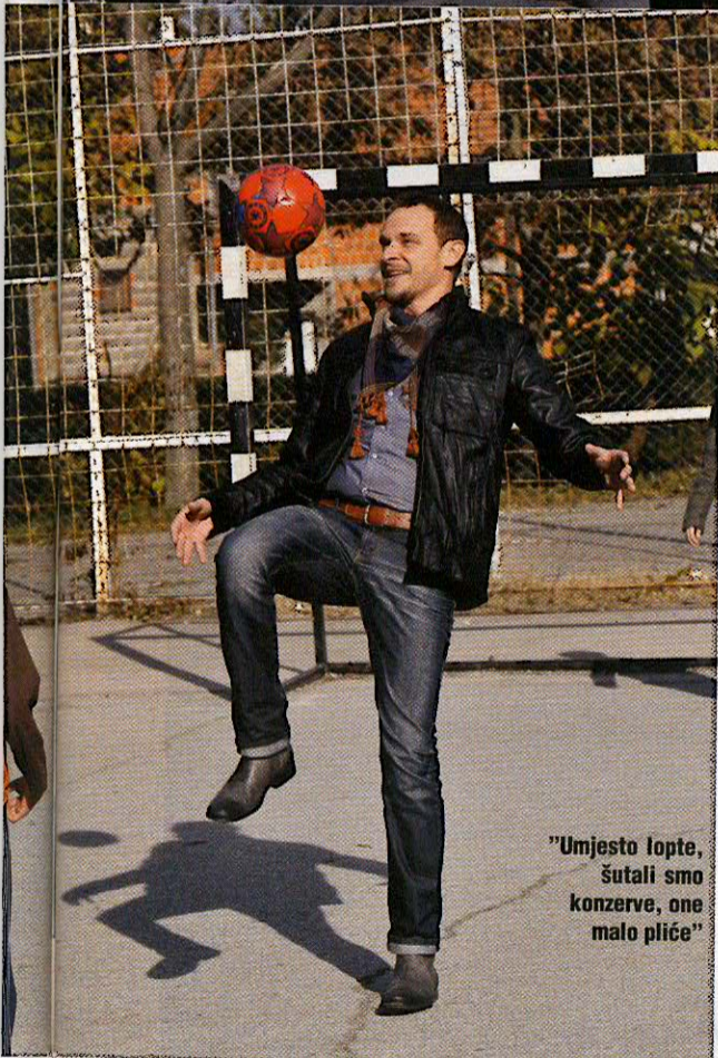
"Umjesto lopte, šutali smo konzerve, one malo pliće"

odrastala u tom periodu blagostanja, u kojem si se liječio i popravljao zube na knjižicu, a nisi plaćao. Mogao si pustiti dijete napolje da se igra po čitav dan i da ga zovneš samo na ručak ili užinu; danas moraš stražariti pored djeteta dok se igra. Tu bezbrižnost naša djeca neće osjetiti.