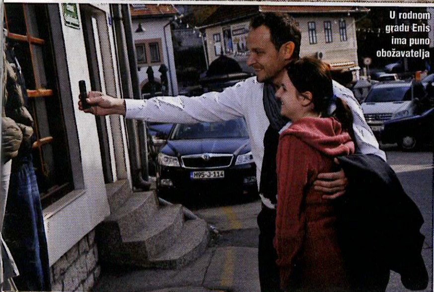
U rodnom gradu Enis ima puno obožavatelja