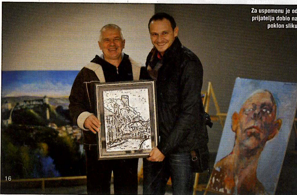
Za uspomenu je od prijatelja dobio na poklon sliku

JESMO LI ZNALI? "Tešanj ima najstarije pozorište u BiH, a država ne brine o takvim stvarima; imao je prvu banku u BiH; ovdje se odigrao prvi teniski meč u BiH; ima građevine koje su počeli graditi Rimljani, a završili Turci..."