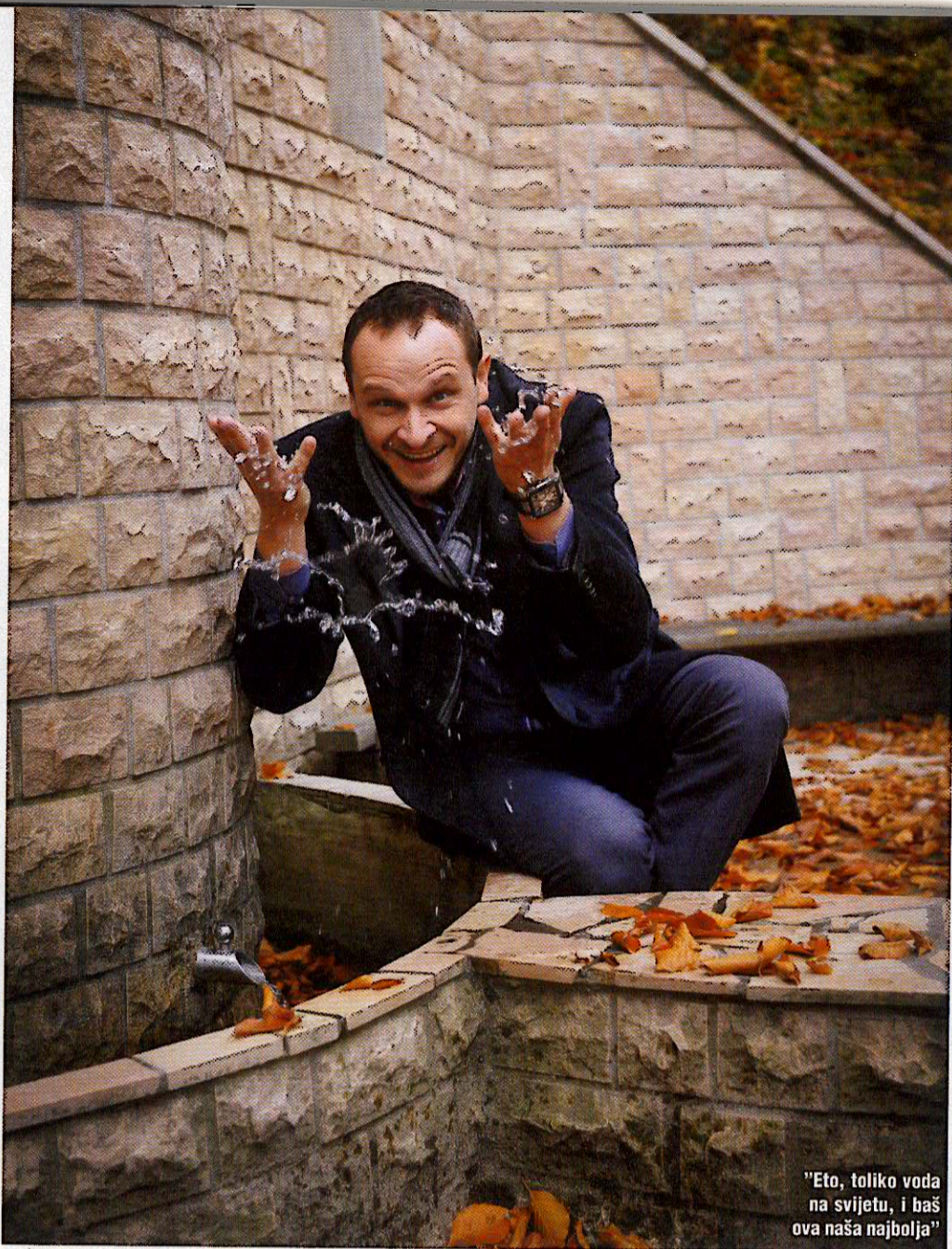
"Eto, toliko voda na svijetu, i baš ova naša najbolja"

– Gradina je bila mjesto izlaska. To je kao nekakav stari grad, s tvrđavama i kulama. S Gradine puca prekrasan pogled na Tešanj i ona je ponos grada.